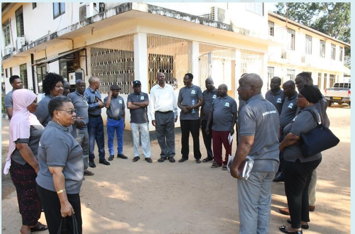
Wah. Madiwani Halmashauri ya Wilaya ya Siha wakiwa kwenye mafunzo Wilayani Tandahimba yenye lengo la kuboresha sekta ya Elimu Msingi na Sekondari kwa kusimamia uendeshaji wa mfuko wa elimu ili uwezeshe miundombinu mashuleni Agosti 2, 2024.