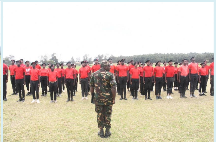
vijana 51 wanaohudhuria mafunzo ya awali ya 14 ya jeshi la akiba wakiwa kwenye hafla fupi ya ufunguzi wa mafunzo hayo kwa Wilaya ya Siha Agosti 15, 2024 yanayofanyika kwenye Uwanja wa Isanja ulipo Kata ya Nasai.