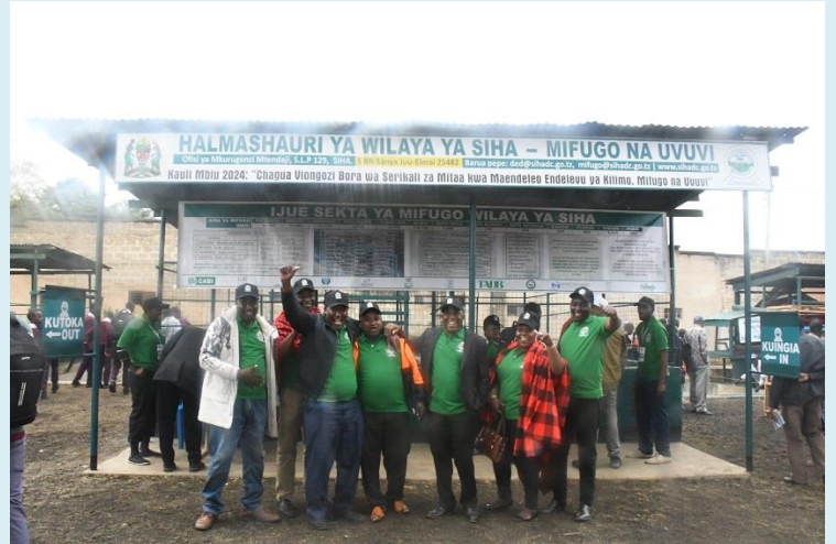
Waheshimiwa Madiwani Halmashauri ya Wilaya ya Siha wakiwa kwenye viwanja vya maonesho ya Nanenane Njiro Mkoani Arusha tarehe 8 Agosti, 2024.