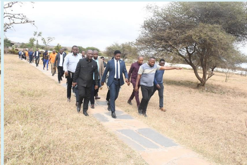
Waziri wa Viwanda na Biashara Mhe. Dkt Selemani Jafo Agosti 23, 2024 alipotembelea eneo la uwekezaji la bustani ya wanyamapori ya Serval (Serval Wildlife) Kwa ajili ya kujionea shughuli za uwekezaji katika sekta ya utalii uliofanyika katika Wilaya ya Siha.