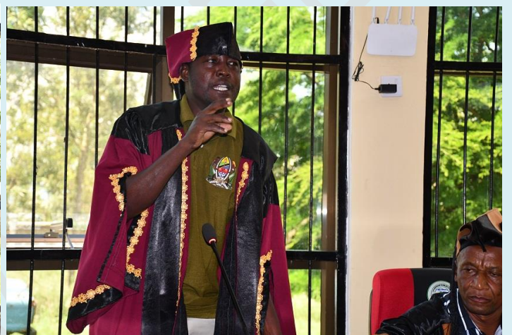
Baadhi ya Viongozi wa Serikali Mkoa na Wilaya, Chama Tawala na Taasisi za Serikali wakichangia mjadala kwenye Mkutano wa kawaida wa Baraza la Madiwani Robo ya kwanza ya mwaka wa fedha 2023/24 uliofanyika Novemba 07, 2023.