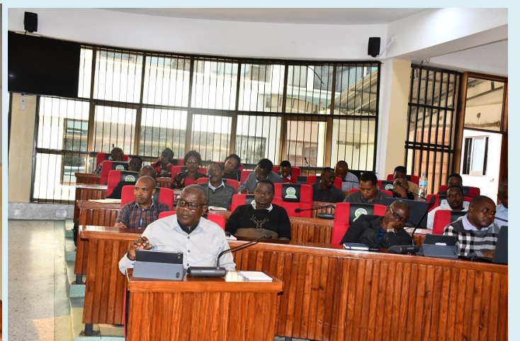
Waheshimiwa madiwani, Mkurugenzi Mtendaji wa Halmashauri ya Wilaya ya Siha na Wataalamu wakiwa kwenye Mkutano wa kawaida wa Baraza la Madiwani wa Robo ya kwanza ya Mwaka wa Fedha 2023/2024 uliofanyika Novemba 7, 2023 katika Ukumbi wa Halmashauri ya Wilaya ya Siha.