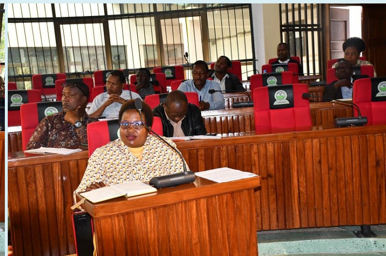
Baadhi ya viongozi wa Mkoa na Wilaya na Wataalamu walioshiriki kwenye mkutano wa Dharura wa Baraza la Madiwani uliofanyika Novemba 14, 2023 katika ukumbi mkubwa wa makao makuu ya halmashauri ya wilaya ya siha.