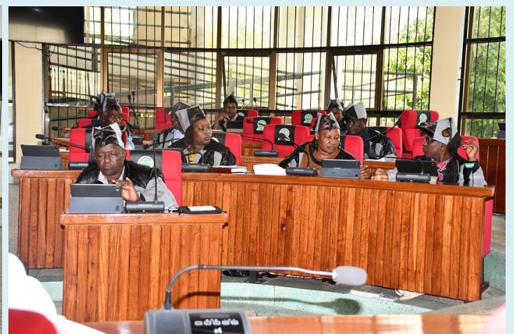
Waheshimiwa Madiwani wakiwa kwenye Mkutano wa kawaida wa Baraza la Madiwani wa Robo ya kwanza ya mwaka wa fedha 2023/24 uliofanyika Novemba 07, 2023 katika Ukumbi Mkubwa wa Makao Makuu ya Halmashauri ya Siha.