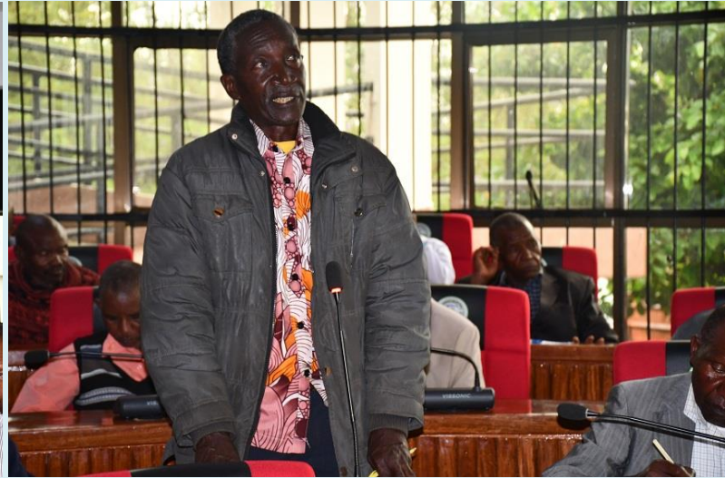
Baadhi ya Viongozi wa vyama vya Ushirika wakitoa ushauri na mapendezo ya kuboresha vyama vya ushirika Wilayani Siha ukumbi wa Halmashauri Novemba 16, 2023