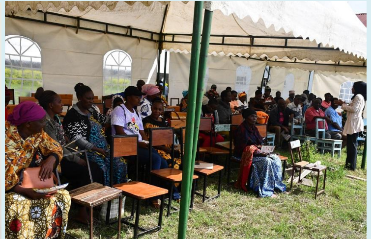
Baadhi ya Wananchi wa Wilaya ya Siha waliojitokeza kupata huduma za kibingwa za Vipimo na Matibabu ya Magonjwa ya moyo yaliyokuwa yakitolewa na Madaktari Bingwa kutoka Taasisi ya Moyo Jakaya Kikwete (JKCI) kuanzia Desemba 18, 2023 hadi Desemba 24, 2023 katika Hospitali ya Wilaya ya Siha