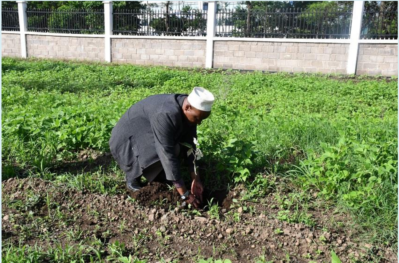
Baadhi ya Viongozi wa Dini Wilaya ya Siha wakishiriki zoezi la upandaji miti katika eneo la Makao Makuu ya Halmashauri ya Wilaya ya Siha siku ya Maadhimisho ya Miaka 62 ya Uhuru wa Tanzania Bara Desemba 09, 2023.