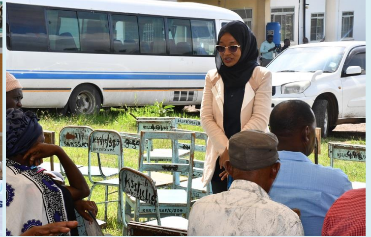
Wataalamu wa afya kutoka Taasisi ya Moyo Jakaya Kikwete (JKCI) wakitoa huduma za vipimo na ushauri wa masuala ya Lishe kwa wananchi wa Wilaya ya Siha waliojitokeza kufanyiwa vipimo na matibabu ya magonjwa ya moyo kwenye Hospitali ya Wilaya ya Siha kuanzia Desemba 18 hadi Desemba 24, 2023