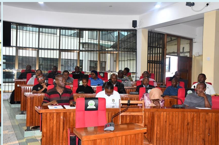
Baadhi ya washiriki wa Kongamano la Maadhimisho ya Miaka 62 ya Uhuru yaliyofanyika Desemba 09, 2023 kwenye Ukumbi wa Makao Makuu ya Halmashauri ya Wilaya ya Siha.