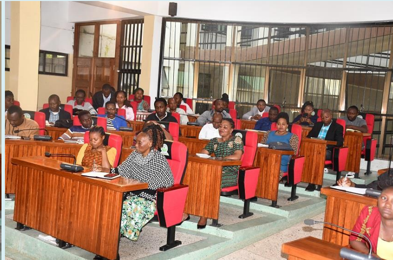
Washiriki waliohudhuria mafunzo yaliyotolewa na Taasisi ya kuzuia na kupambana na rushwa (TAKUKURU) Wilaya ya Siha Desemba 01, 2023