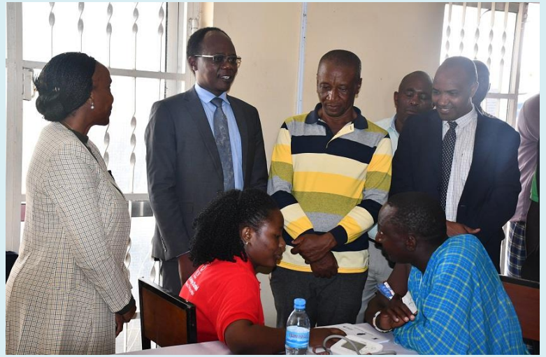
Naibu waziri wa Afya na Mbunge wa Jimbo la Siha Mhe. Dkt Godwin Mollel akiwasikiliza Madaktari bingwa kutoka Taasisi ya Moyo Jakaya Kikwete (JKCI) baada ya ufunguzi wa huduma za vipimo na matibabu ya magonjwa ya moyo yaliyokuwa yakitolewa na taasisi hiyo katika Hospitali ya Wilaya ya Siha kuanzia Desemba 18, 2023 hadi Desemba 24, 2023