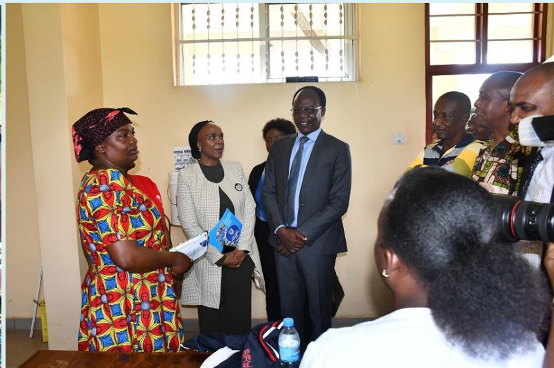
Naibu Waziri wa Afya na Mbunge wa Jimbo la Siha Mhe Dkt Godwin Mollel akizungumza na wananchi na wakazi wa Wilaya ya Siha baada ya kukabidhi Gari na Vifaa Tiba vyenye thamani ya zaidi ya Milioni 900 kwenye Hospitali ya Wilaya ya Siha.