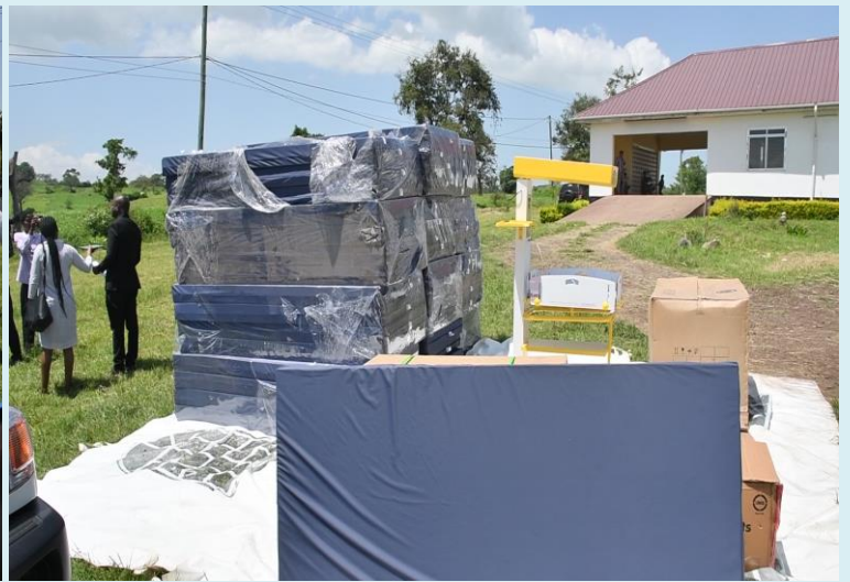
Gari la Mganga Mkuu wa Wilaya ya Siha na Baadhi ya Vifaa Tiba vyenye thamani ya zaidi ya Milioni 900 vilivyokabidhiwa katika Hospitali ya Wilaya ya Siha na Naibu Waziri wa Afya na Mbunge wa Jimbo la Siha Mhe. Dkt Godwin Mollel kwa lengo la kuendelea kuboresha huduma za afya zinazotolewa kwa Wananchi na Wakazi wa Wilaya ya Siha.